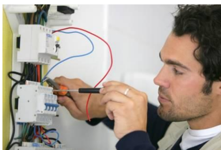
An electrician Un électricien