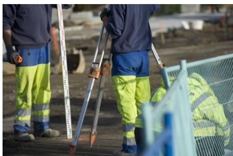
A (land) surveyor Un géomètre