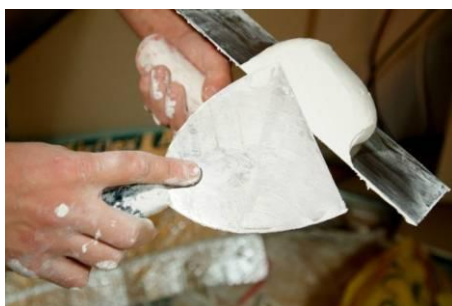
A plasterer Un plâtrier