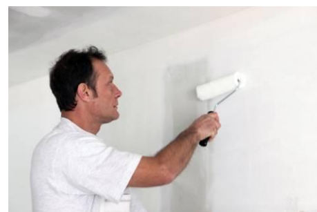
A house painter Un peintre en bâtiment