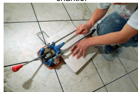
A (floor) tiler Un carreleur