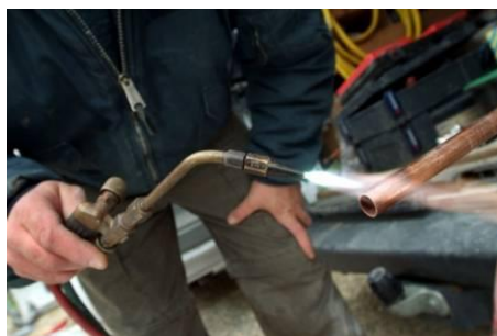
A welder Un soudeur