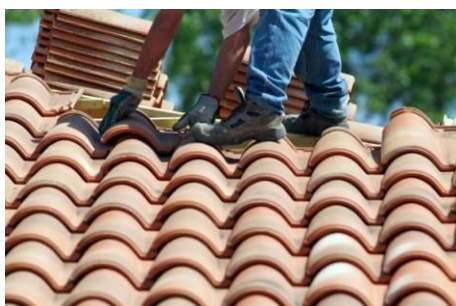
A roofer Un couvreur