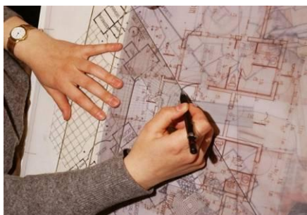
An architect Un architecte