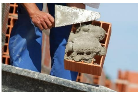
A bricklayer Un maçon