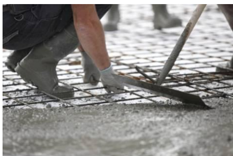
A form setter Un coffreur