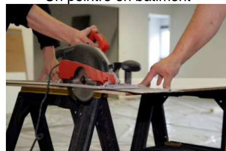
A joiner / carpenter Un menuisier