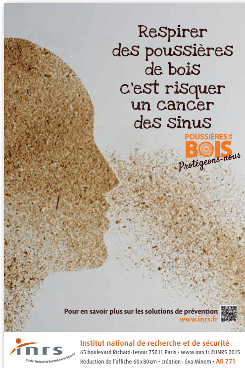
INRS, A 771.