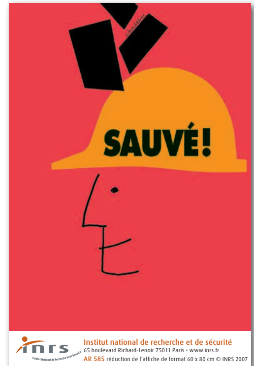
INRS, A 585.